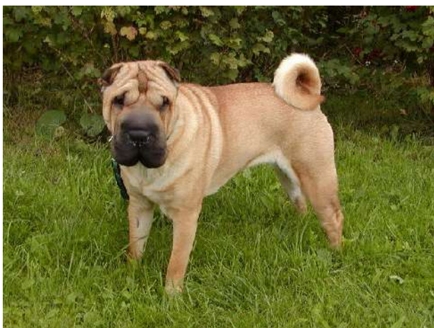
matka : CAECILLIA Crease Pei CH. SHENGLI ABSOLUTE POWER NG CH. AYLIN CREASE PEI

Klubový šampion, Šampion CZ, TOP SHARPEI 2004, Šampion mladých CZ, SK, Klubový šampion mladých, 3.nejlepší dorost FCI, Národní vítěz,4x BOB, 7x CACIB, 2x res.CACIB, 10x CAC, 5x Vítěz tř.mladých, 5x CAJC