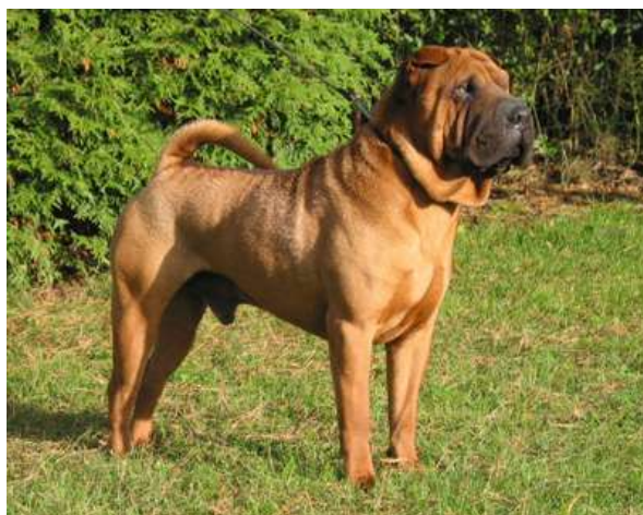
otec: Tsihmaoś Two YIP CH. LOEWAK DES SENTEURS D'OPIUM CH. CHESAPEAKE'S PRUNELLE BEST YOUNG MALE CLUBSHOW SHARPEI CLUB BELGIUM 2000

Klubový šampion, Šampion CZ, TOP SHARPEI 2004, Šampion mladých CZ, SK, Klubový šampion mladých, 3.nejlepší dorost FCI, Národní vítěz,4x BOB, 7x CACIB, 2x res.CACIB, 10x CAC, 5x Vítěz tř.mladých, 5x CAJC